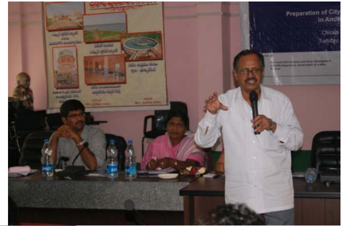
Participants at Chirala workshop Dt. 18 th May 2010