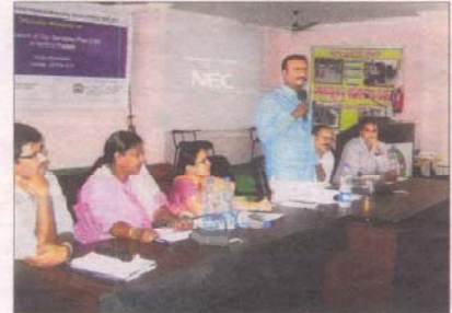
అభివృద్ధికి సహకరించండి అభివృద్ధి కౌన్సిల్ మాట్లాడుతున్న ఎమ్మెల్యే ఆమెంబి చీరాల టౌన్, మే 18