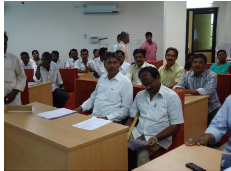
Participants at CSP orientation workshop in Pulivendula on 09-06-2010