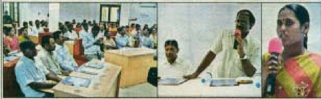
మహిళాసభ సభ్యులు కార్యక్రమం, కృష్ణానది సంరక్షణ, మున్సిపల్ కార్పొరేషన్ల సదస్సులో, కేవలం కార్యక్రమం

పులివెందులూ, మేజిస్ట్రేట్స్: పులివెందులూ మున్సిపల్ కార్పొరేషన్ సదస్సులో పారిశుధ్యంపై ప్రతి ఒక్కరినూ దృష్టి సారించాలని కలవరపెట్టి ప్రైవేట్ సమావేశానికి కేటాయించారు. అవగాహన సదస్సులో మున్సిపల్ కార్పొరేషన్ల సభ్యులతో కలిసి పాల్గొన్నారు. అవగాహన సదస్సులో ప్రతి ఒక్కరినూ దృష్టి సారించాలని కలవరపెట్టి ప్రైవేట్ సమావేశానికి కేటాయించారు. అవగాహన సదస్సులో మున్సిపల్ కార్పొరేషన్ల సభ్యులతో కలిసి పాల్గొన్నారు. అవగాహన సదస్సులో ప్రతి ఒక్కరినూ దృష్టి సారించాలని కలవరపెట్టి ప్రైవేట్ సమావేశానికి కేటాయించారు. అవగాహన సదస్సులో మున్సిపల్ కార్పొరేషన్ల సభ్యులతో కలిసి పాల్గొన్నారు.