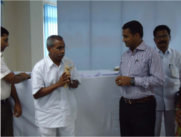
Orientation workshop on CSP at Pulivendula on 09-06-2010

పులివెందులూ మున్సిపల్ కార్పొరేషన్ సదస్సులో ప్రతి ఒక్కరినూ దృష్టి సారించాలని కలవరపెట్టి ప్రైవేట్ సమావేశానికి కేటాయించారు. అవగాహన సదస్సులో మున్సిపల్ కార్పొరేషన్ల సభ్యులతో కలిసి పాల్గొన్నారు. అవగాహన సదస్సులో ప్రతి ఒక్కరినూ దృష్టి సారించాలని కలవరపెట్టి ప్రైవేట్ సమావేశానికి కేటాయించారు. అవగాహన సదస్సులో మున్సిపల్ కార్పొరేషన్ల సభ్యులతో కలిసి పాల్గొన్నారు.